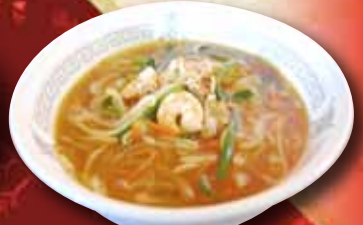
酸辣湯麺(スーラータンメン) 730円