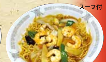
エビあんかけ焼そば 880円