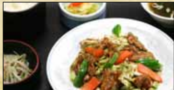
ホイコーロー一定食 730円