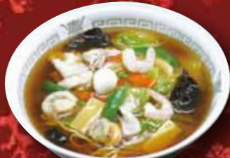
五目あんかけ麺 730円