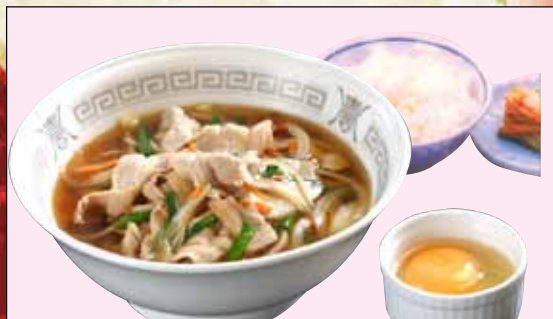
スタミナラーメンセット 930円