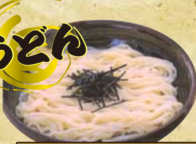
ざるうどん・うどん 500円