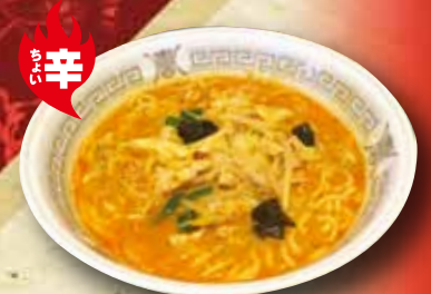
辛味噌ラーメン 680円