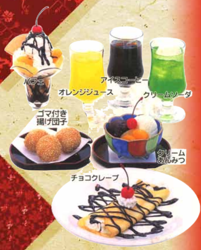
パフェ アイスコーヒー オレンジジュース クリームソーダ ゴマ付き揚げ団子 クリームあんみつ