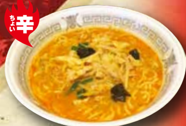
辛味噌ラーメン 680円