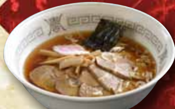
チャーシュー麺 730円