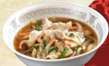
スタミナラーメン 780円