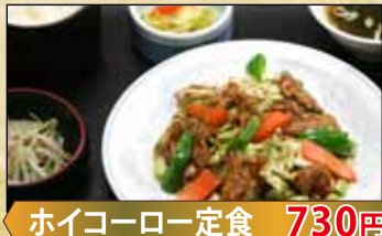
ホイコーロー一定食 730円