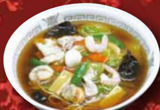
五目あんかけ麺 730円