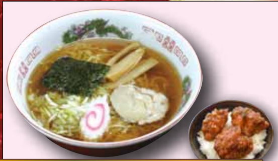
支那ミニからあげ丼セット 750円