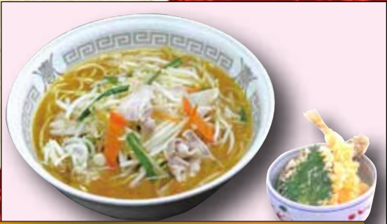
味噌ミニ天丼セット 850円