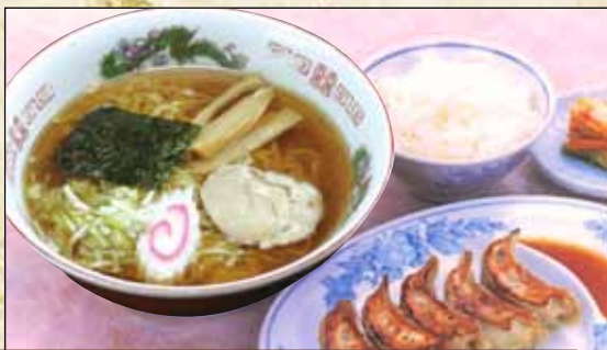
支那そばセット 820円