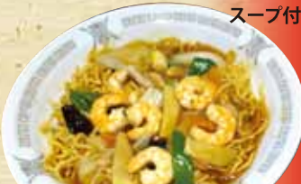
エビあんかけ焼そば 880円